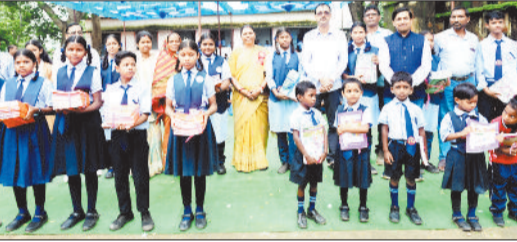
निःशुल्क पुस्तक पाकर खुश हुए नौ- निहाल।