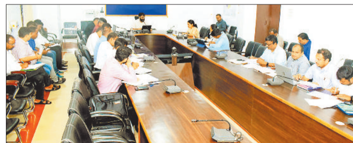
जनपद पंचायतों के सीईओ की बैठक लेते कलेक्टर।

बैठक में कलेक्टर ने प्रधानमंत्री जनमन योजना और धरती आबा जनजातीय ग्राम उत्कर्ष योजना के तहत संचालित विकास कार्यों को प्रमुखता के साथ पूरा करने के निर्देश दिए। इसके साथ ही उन्होंने ग्रामीण क्षेत्रों में प्रधानमंत्री आवास योजना के तहत बन रहे आवासों का नियमित रूप से निरीक्षण करने